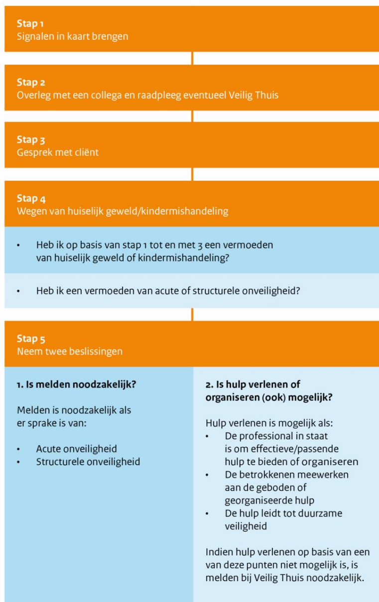
Figuur 1: Stappenplan verbeterde meldcode

kindermishandeling en huiselijk geweld te volgen.